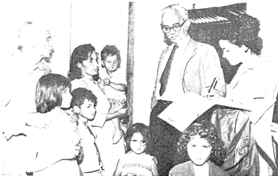
Na foto, uma família de operários, em Sobradinho, quando respondia quesitos à agente.

Realizado pelo MEC, PDF e IBGE, o Censo Escolar do DF é considerado o mais perfeito já realizado no Brasil, pois foi executado em menos de uma semana por pessoal altamente qualificado. Faltando apenas ligeiras correções, o Censo Escolar apurou que vivem no D.F. 268 315 habitantes, sendo 64 004, menores de 7 anos. Dos maiores de sete anos (204 311), 154 541 sabem ler e escrever e 49 770 são analfabetos. Moram no Plano Piloto 89 231 pessoas, seguindo-se Taguatinga (68 947) e Gama (27 524 habitantes).