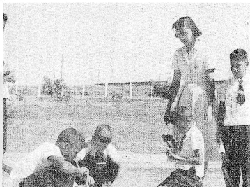
One of the Elementary School of Brasilia, that presently has ten and a half and more schools maintained by Novacap, besides the courses of the Popular Home Foundation and adult alphabetizing courses operating in all big camps and in the works of the IAPI