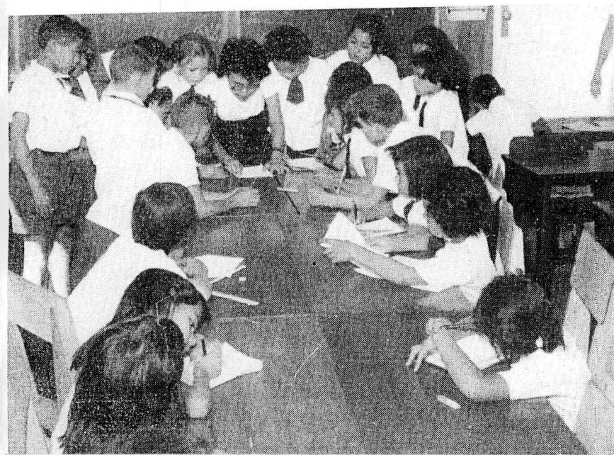
L'une des Ecoles Primaires de Brasilia, qui actuellement compte avec plus d'une dizaine et demi maintenues par la Novacap, outre les cours de la Maison Populaire et les cours d'alphabétisation dans les cantonnements et dans les oeuvres organisées par le IAPI.