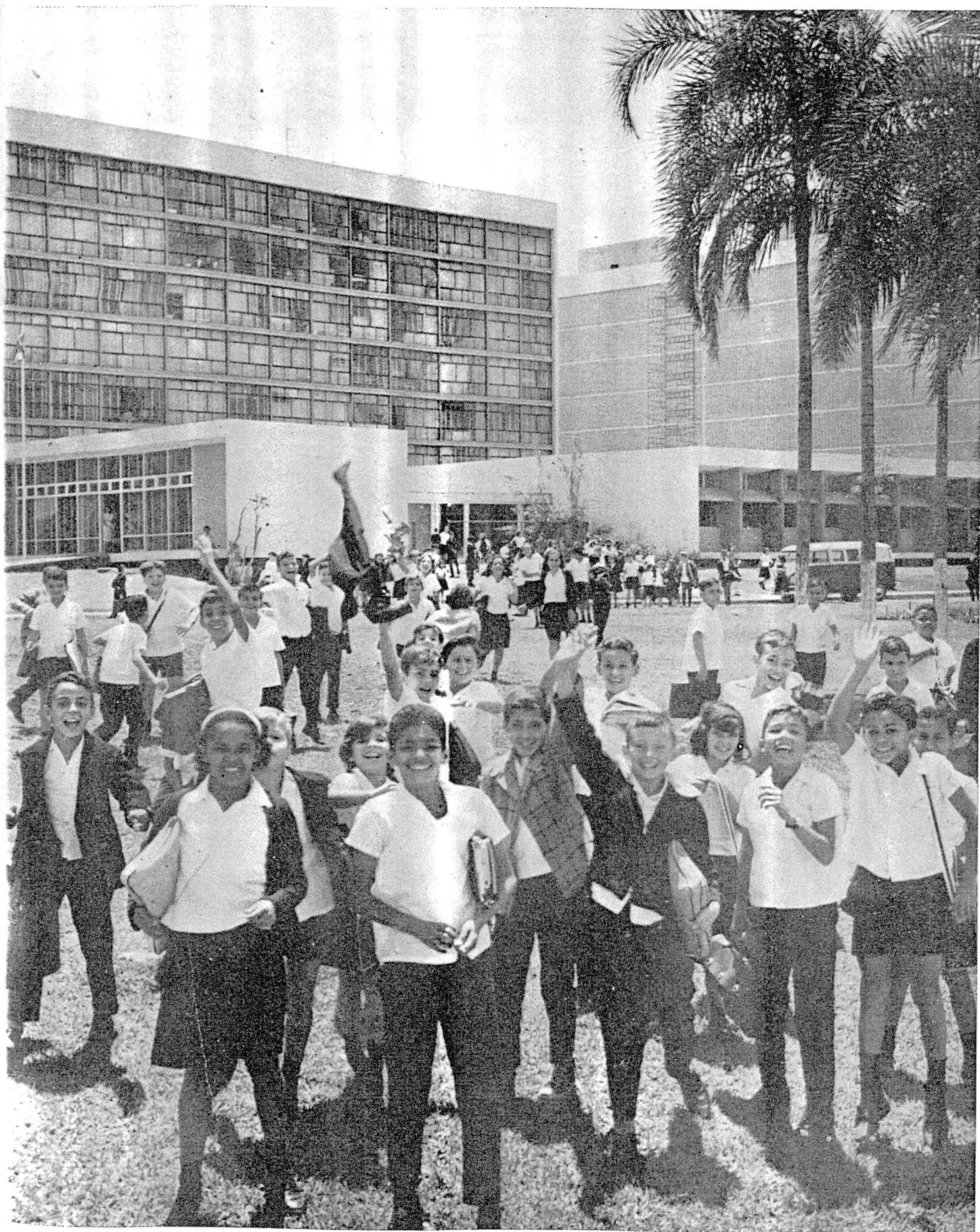
O CENSO ESCOLAR SABE QUANTO SOMOS E QUANTAS CRIANÇAS AINDA NECESSITAM DE ESCOLAS, NO DISTRITO FEDERAL