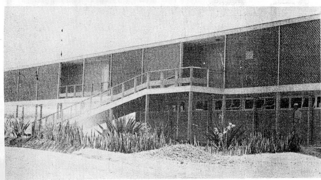
Grupo Escolar em Brasília, atualmente com mais de uma dezena e meia mantidos pela Novacap, além de cursos primários e ginasiais no Núcleo Bandeirante e na Fundação da Casa Popular, e cursos de alfabetização em todos os grandes acampamentos e nas obras do IAPI.