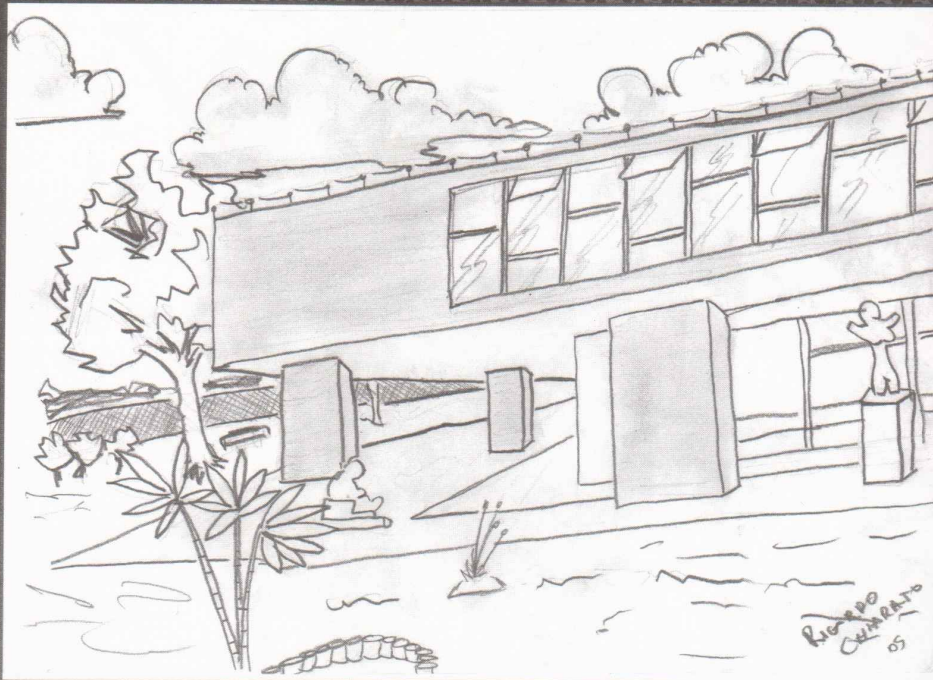
Museu de Arte de Brasília