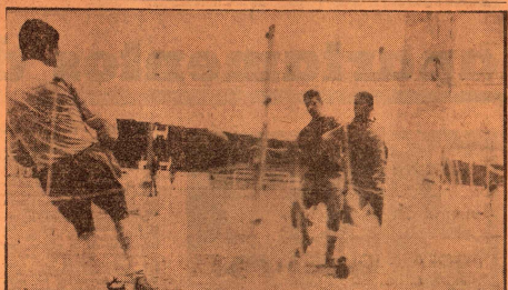
Cine foi uma das grandes figuras do treino de a noite em e aparece na foto quando marcou o primeiro gol, em Alberto

Tão volte a seguir a continúe, mas não ocultam em atende-za, a equipe, dependendo, de-ter-tinido do coletivo desta manhã e bem sabem de seu estado, pois que se trata do Botafogo como fovei pela vitória e a transfere maua equipe limpo e brilhante como temível e brilhante estive, domingo, Didi em sua jogabilidade.