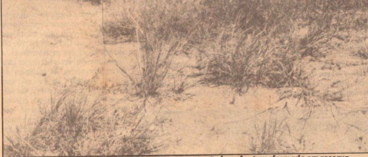
O cerrado poderá ter um desenvolvimento auto-sustentado se for transformado em reserva

Um dos principais santuários ecológicos do País, a Reserva de Águas Emendadas, possui seis quilômetros de extensão e se caracteriza pelo encontro das duas maiores bacias hidrográficas brasileiras: a Platina e a Amazônica. No jardim botânico, outra área reservada para a preservação ambiental, funciona o horto medicinal, pioneiro no Centro-Oeste, e responsável pela classificação e cultivo de mais de 100 ervas nativas. (A.B.M.)