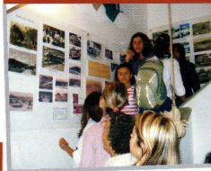
2007. EXPOSIÇÃO de longa duração "XERÉM, LUGAR DE MEMÓRIAS, HISTÓRIA E TRABALHO", na Igreja Nossa Senhora das Graças, em Xerém. Acervo CEPEMHED e CRPH.

Projeto DIGITAIS DE UMA CIDADE. Instalação de Núcleos de Revitalização dos Lugares de Memória e da História da Cidade de Duque de Caxias