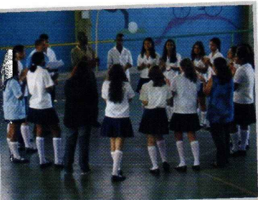
2007.

Projeto "MENINA, QUEM FOI SEU MESTRE? O corpo e a musicalidade na formação dos docentes da Educação Básica", desenvolvido com estudantes do Curso Normal, em parceria com o Projeto Ação Griô Nacional, em ação conjunta com o Instituto de Educação Governador Roberto Silveira e o Instituto Histórico Ver. Thomé S. Barreto.