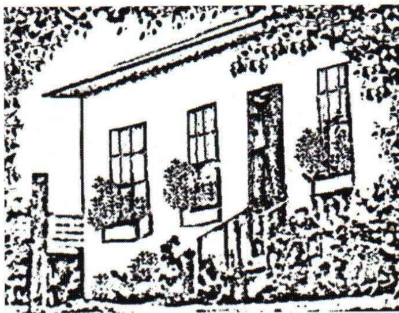
CENTRO DE PESQUISA, MEMÓRIA E HISTÓRIA DA EDUCAÇÃO DA CIDADE DE DUQUE DE CAXIAS E BAIXADA FLUMINENSE 1

“Lembrar não é reviver, mas refazer, reconstruir, repensar com imagens e idéias de hoje, as experiências do passado” 1