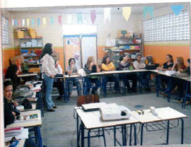
2008. Escola Dr. Alvaro Alberto.

Consiste em estimular a consolidação de grupos de estudos e assessorar a comunidade escolar para pesquisa da história da respectiva instituição e organização de seu próprio espaço museal. São realizados, ainda, estudos de campo no entorno da instituição, com a participação do Centro de Referência Patrimonial e Histórico (CRPH).