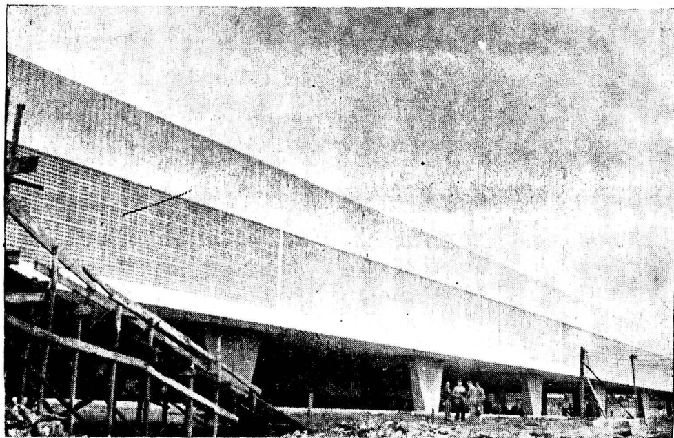
Na gravura temos um aspecto do que será a nossa Escola Média de Brasília