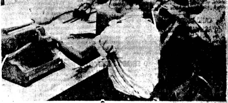
Funcionários do Departamento dos Correios e Telégrafos operando os teletipos que põem Brasília em permanente contato com o Estado da Guanabara.