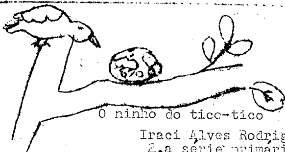
O ninho do tico-tico

Devemos amá-las com carinho e desvelo, não cortando essas árvores que são de grande utilidade à humanidade; essas que o homem indo em busca de abrigo, encontra flores, frutos e sombra.