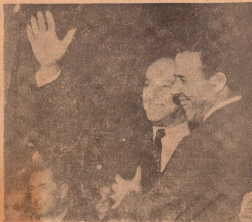
Lott e Jango unidos pela continuidade e pela intensificação do desenvolvimento nacional (Convenção do P. T. B.)