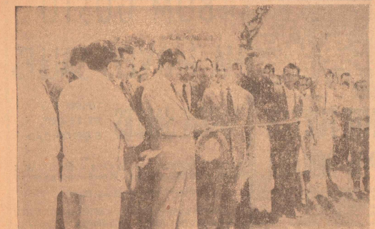
APARTAMENTOS PARA FUNCIONÁRIOS — No momento em que se procedia a uma das muitas inaugurações que atestam o dinamismo de NOVACAP, fizemos esta fotografia. Nela vemos o Presidente Kubitschek inaugurando um bloco de 840 apartamentos para funcionários públicos

Não quisemos prolelar um só dia a realização de velho anseio — lançar um jornal em Brasília, a serviço leal desta Metrópole que surge como afirmação (CONCLUÍ NA 3.ª PAGINA)